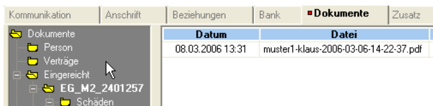
Bild: Eingereichtes Geschäft mit PDF-Datei in der Dokumentenübersicht